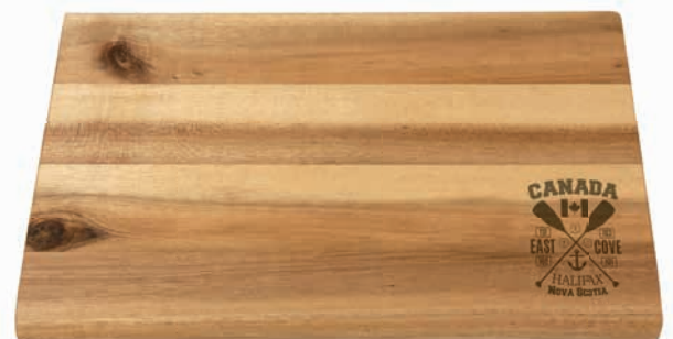
Frühstücksbrettchen, 23 x 15 cm, Beispiele Brandstempel

Lieferzeit: ca. 2 Wochen nach Produktionsfreigabe Angebot freibleibend, Preise zzgl. MwSt. ab Werk, Irrtümer vorbehalten.