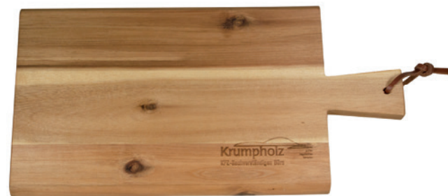
Brotzeitbrett geölt mit Beispiel Lasergravur