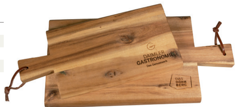
In den Größen 29 x 14 x 1,5 cm (28190) und 35 x 18 x 1,5 cm (28191) erhältlich

Lieferzeit: ca. 3-4 Wochen nach Produktionsfreigabe | Fixtermin? Fragen Sie nach unserem Express-Service!