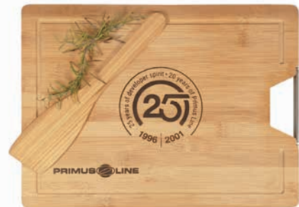
Bambus-Schneidebrett groß, Beispiel Brandstempel