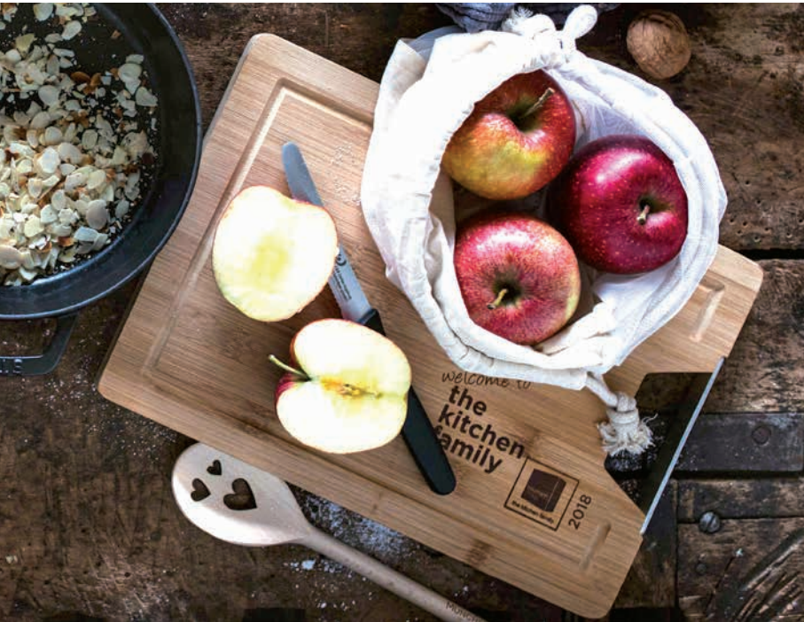
Bambus-Schneidebrett klein mit silbernem Edelstahlgriff, Beispiel Einbrand