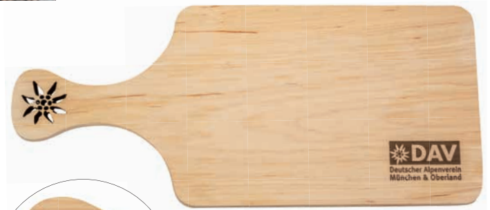
Brotzeitbrett Erle, 32 x 14 cm, geölt, Beispiel Laserschnitt und Lasergravur