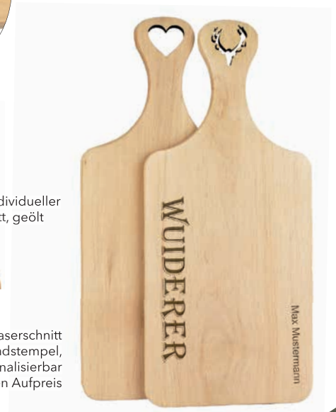
Beispiele Laserschnitt und Brandstempel, individuell personalisierbar gegen Aufpreis

Lieferzeit: ca. 2 Wochen nach Produktionsfreigabe | Fixtermin? Fragen Sie nach unserem Express-Service!