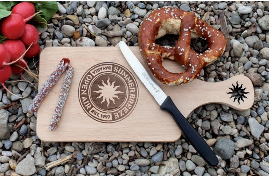
Brotzeitbrett Erle, nicht geölt, Beispiel Laserschnitt und Brandstempel