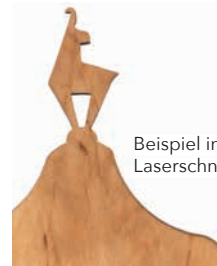
Beispiel individueller Laserschnitt, geölt