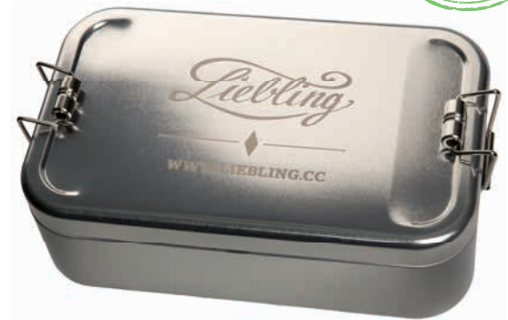
Lunchbox XL mit stabilen Bügelverschlüssen und Lasergravur

Praktische, hochwertige Lunchbox mit lebensmittelechtem Schutzlack im zeitlosen Design aus stabilem Weißblech und gut verschließbarem Stülpedeckel. Zum sicheren Transport von belegten Broten, Obst und Gemüse. Nicht für Geschirrspüler geeignet, wir empfehlen die Reinigung von Hand. Die Lunchbox kann auf dem Blechdeckel mit Lasergravur, Prägung oder Digitaldruck veredelt werden.